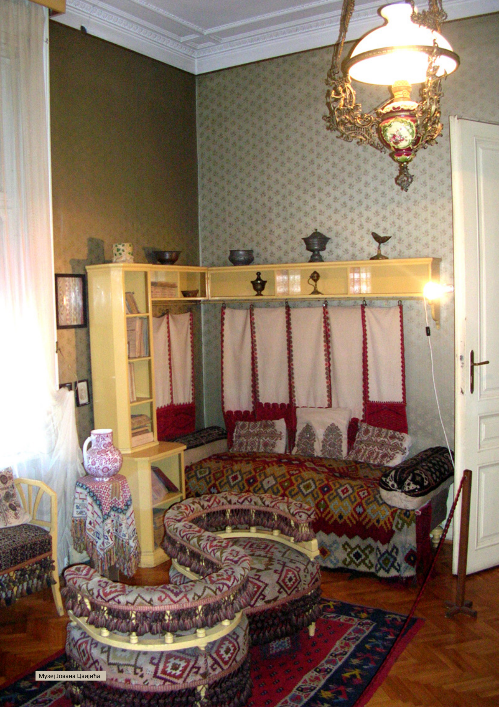
Музеј Јована Цвијића