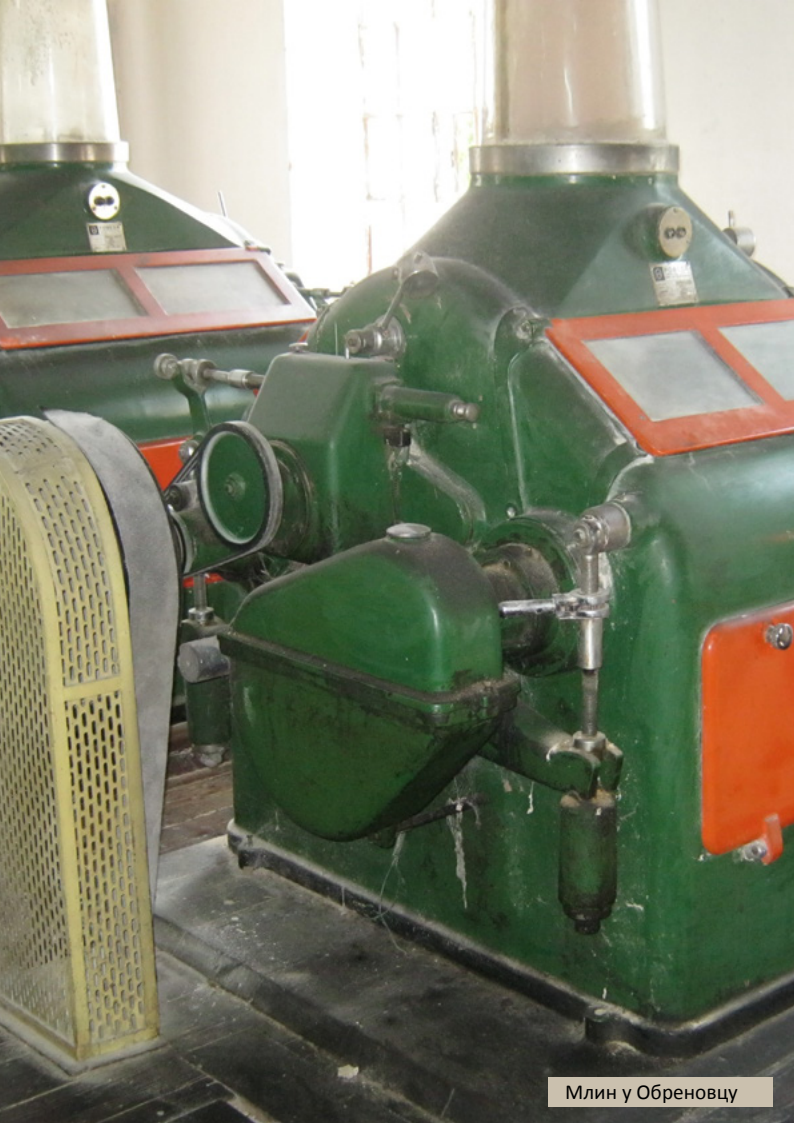
Млин у Обреновцу